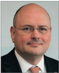
Arne Schönbohm Präsident des Bundesamtes für Sicherheit in der Informationstechnik